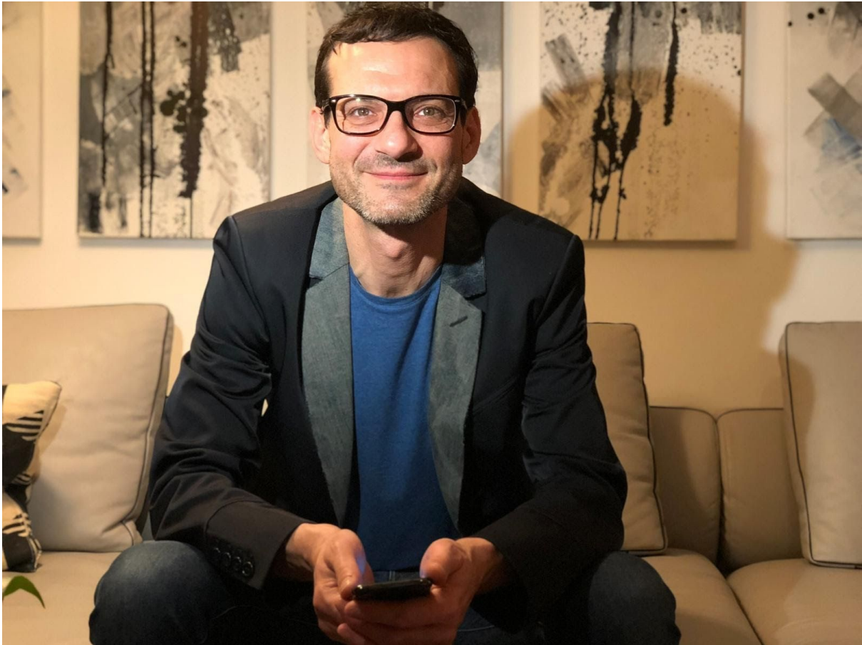
Sigismund Gänger

Die snorefree Health App wurde für iOS und Android-Geräte entwickelt und ist die digitale Umsetzung eines effektiven Anti-Schnarchtherapie, die vom snorefree Co-Founder und Logotherapeuten Dario Lindes in über 10 Jahren Praxis entwickelt wurde.