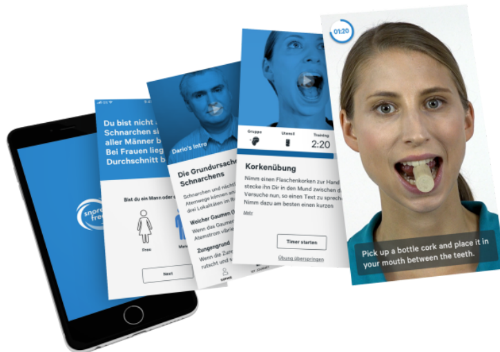
Screenshots snorefree App

Snorefree kann nicht von heute auf morgen seine User schnarchfrei machen, aber bereits mit wenigen Einheiten die lästigen Schnarch-Geräusche reduzieren. Denn als erste App weltweit bietet snorefree ein speziell eigens entwickeltes logopädisches Videoworkout, das die Muskulatur im Hals, Rachen und Mundbereich gezielt stärkt. Alle Übungen werden detailliert erklärt und können am Smartphone abgespielt und jederzeit vom User ausgeübt werden. Ein spezieller Algorithmus stellt dem User ein personalisiertes Trainingsprogramm zusammen und unterstützt so den Erfolg. Somit sorgt snorefree für die rasche, schmerzfreie Linderung bis zur kompletten Beseitigung von Schnarch-Geräuschen. Die App ist für iOS und Android derzeit in den Sprachen deutsch & englisch verfügbar. Die Gratis Test Version bietet sechs Übungen zum kostenlosen und unverbindlichen kennenlernen. Die Vollversion kann jetzt um 1,99 für das 1. Monat ausprobiert werden, in der Verlängerung gibt es den Monatstarif um 9,99 Euro/Monat. Für die empfohlene Mindestdauer der Therapie von drei Monaten ist die „3 Monate Soft Variante“ um 26,99 Euro erhältlich. Langzeit-Nutzer genießen den besonders günstigen Tarif „12 Monate Bestpreis“ um 89,99 Euro.